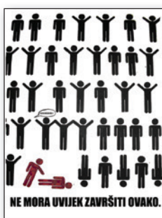
Škola za primijenjenu umjetnost, Rijeka