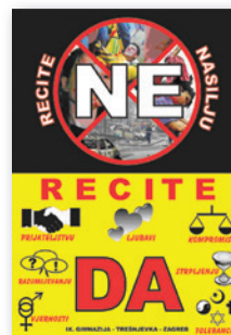
IX. gimnazija, Zagreb, Nagradjeni plakat